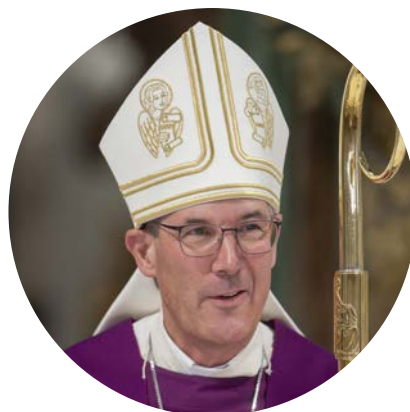
Bischof Beat Grögli

Eine besondere Freude war die Wahl am 22. Mai 2025 von Beat Grögli zum Bischof. Mit ihm haben wir einen Bischof, der als ehemaliger Dompfarrer und Vertreter des pastoralen Gesamtkonzepts unserer Kirchgemeinde etwas näher steht.